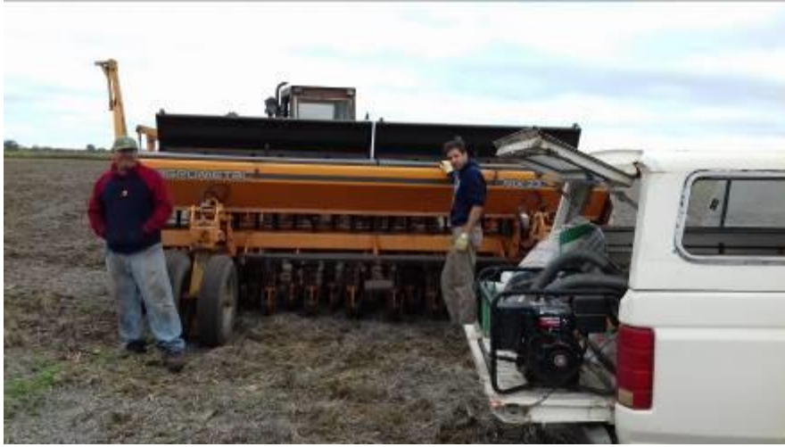
Siembra del ensayo