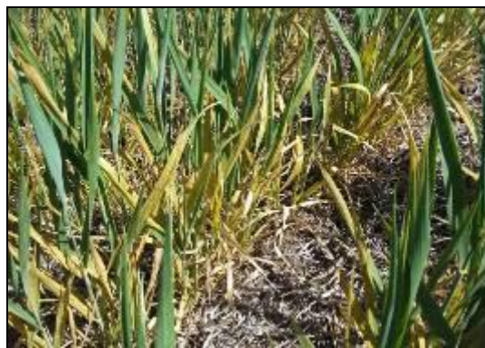
Cultivo de trigo afectado por roya amarilla y anaranjada.