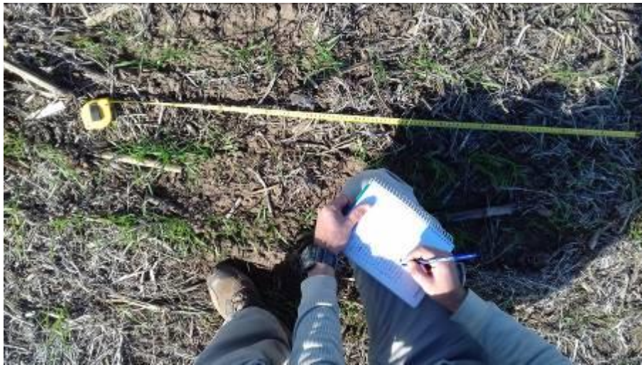
Conteo de plantas nacidas

La cosecha se realizó el día 26 de noviembre de 2017. Lo cosechado de cada parcela se pesó utilizando tolva balanza especial para ensayos con una precisión de 2 kg. Los resultados se corrigieron por superficie y humedad del grano y se evaluaron estadísticamente mediante Test LSD (Mínima Diferencia Significativa).