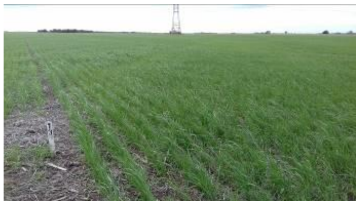
Estado del ensayo antes de las heladas.