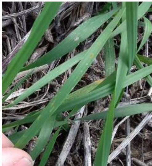
Primeras pústulas de roya anaranjada en trigo susceptible (INTA Jesús María)

En la evaluación del 18/09/2017 de las variedades de los ensayos, determinaron los siguientes niveles: