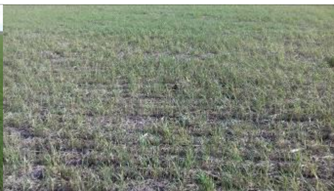
Estado del ensayo después de las heladas.